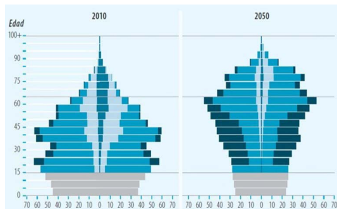
China: Política del hijo único