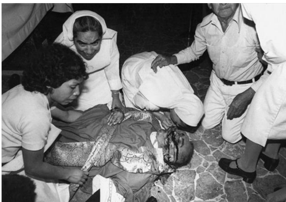
Mn. Romero asesinado durante la celebración de la eucaristía, marzo-1980.

El domingo de Ramos de 1980, Romero hacía su última homilía. Con sus palabras firmaba la sentencia de muerte: "A los hombres del Ejército, ... hermanos ... ningún soldado está obligado a obedecer una orden contra la ley de Dios, ... recuperen su conciencia, ... en nombre de Dios ... les suplico, les ruego, les ordeno en nombre de Dios: Cese la represión ". Horas después era asesinado celebrando misa en la capilla de las religiosas del Hospital de la Divina Providencia.